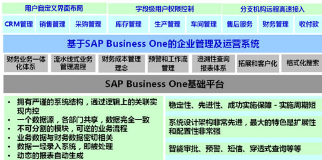
HCC EMOS For SAP Business One功能结构图

将有效地帮助企业实现及时、全面、准确的数据共享与数据分析和一体化的运作管理，让企业管理者能实时地掌握可靠的资料，从而做出准确的商业决策，令公司业务运作更为顺畅。在业务运作方面协助企业有效管理多元化业务，处理繁琐的销售、财务、仓库等业务流程，让企业更有效地管理和组织现有的客户资料，开拓崭新的业务商机。